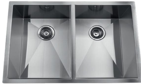
STAINLESS STEEL GQD2920A